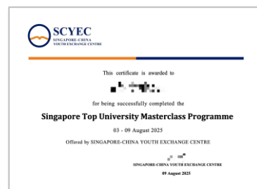
项目结业证书 (样例)