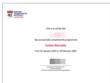
项目结业证书 (样例)