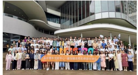
图为参访学校前大合影

除了学习之外，同学们还参访了新加坡国立大学、新加坡金融局、新加坡重建局、新加坡高等法院等单位，通过对当地机构的实地学习，了解高等教育体系建设、经济建设、国家规划、法律治理与公共政策等。积累了一手调研资料，全面提升访学交流的视野与意义。