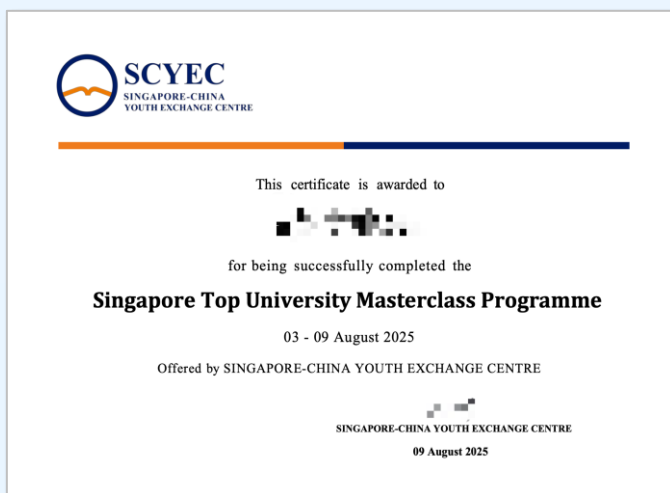
项目结业证书 (样例)