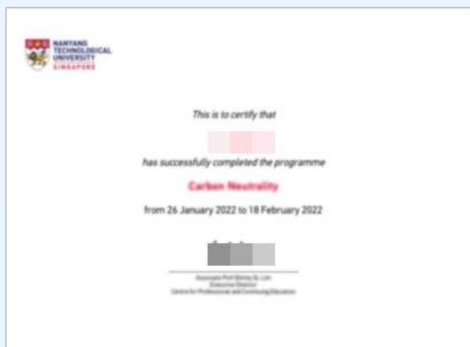
项目结业证书 (样例)