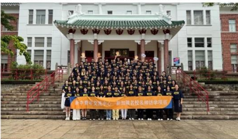
图为开幕式大合影